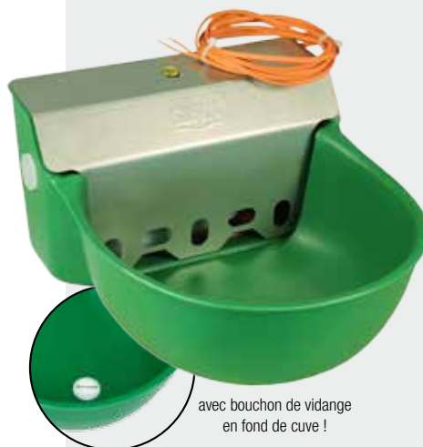
avec bouchon de vidange en fond de cuve !