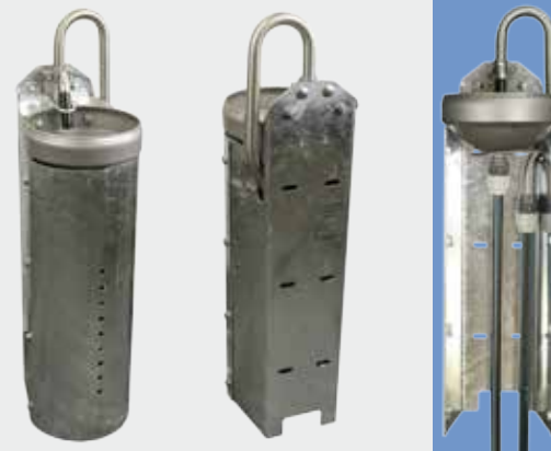
100.1239 + Accessoires pour circuit en boucle et résistance