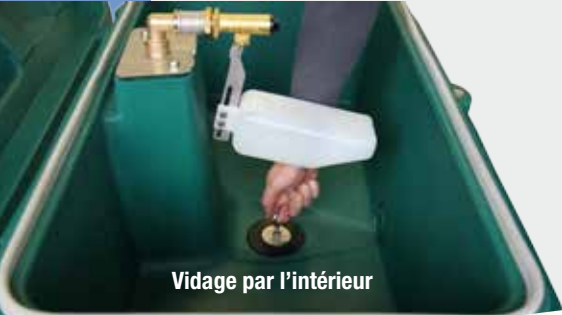
Vidage par l'intérieur