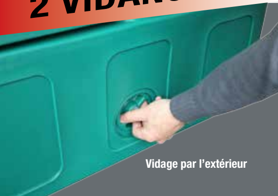
Vidage par l'extérieur

Il n'y a plus d'humidité ou de sol verglacé devant la bonde de vidange de l'abreuvoir grâce à sa seconde bonde à l'intérieur !