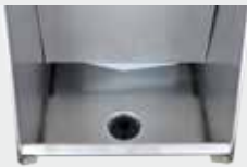
Bonde de vidange vue de l'intérieur