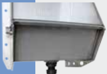
Bonde de vidange vue de l'extérieur