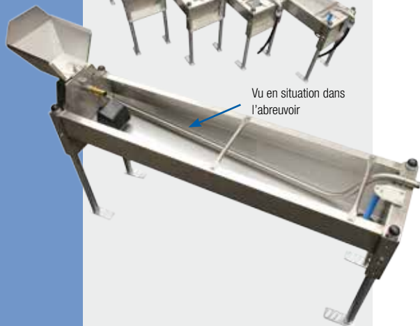
Exemple de montage avec coude inox (accessoires) et tuyau avec raccords PE: