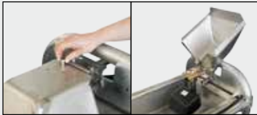
Accès au flotteur par capot relevable, sans outils