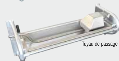
Tuyau de passage 1"