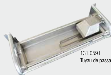
131.0591 Tuyau de passage 3/4"