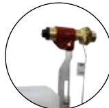
Manchette chauffante 131.0527

Pour les régions ayant un hiver rigoureux une manchette chauffante pour la soupape Modèle 527 (24 V, 7 W, réf. 131.0527) peut être installée postérieurement.