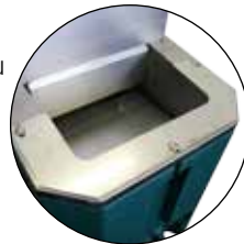
Rebord anti-lapage (réf. 131.1193) limite le gaspillage d'eau