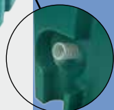
Bonde de vidange: l'eau peut aussi s'évacuer par l'extérieur du socle.