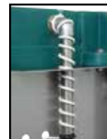
Version chauffante, arrivée d'eau à l'air libre avec un câble chauffant