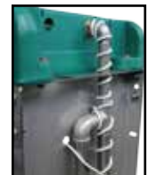
Version chauffante, raccordement à un circuit en boucle avec un câble chauffant