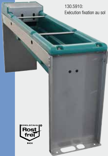
130.5910: Exécution fixation au sol