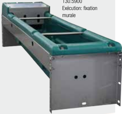
130.5900 Exécution: fixation murale