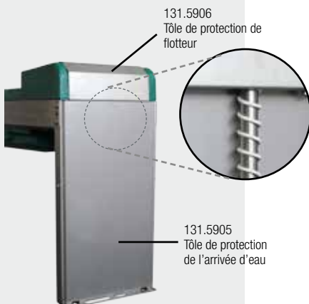
131.5906 Tôle de protection de flotteur