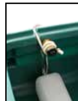
avec un câble chauffant autour du flotteur