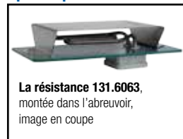
La résistance 131.6063 , montée dans l'abreuvoir, image en coupe