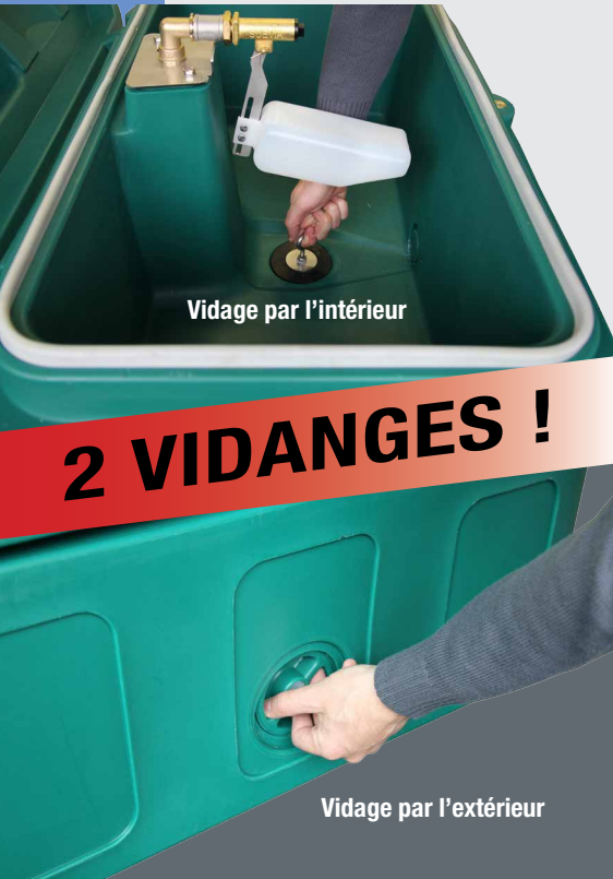
Vidage par l'intérieur