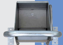
131.1391 Protection, galvanisée pour Mod. 480, 500, 600