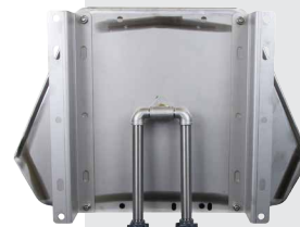
¾": 103.3004 1": 103.3007 pour Mod. 620