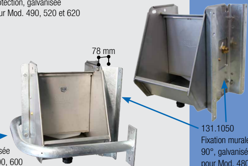
131.1050 Fixation murale 90°, galvanisée pour Mod. 480, 500, 600