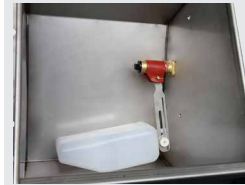
Manchette chauffante pour la soupape (réf. 131.0527)