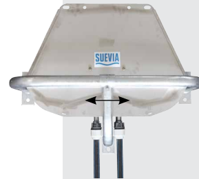
131.1393 Protection, galvanisée pour Mod. 490, 520 et 620