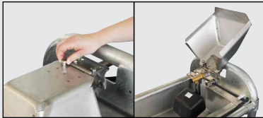
Accès au flotteur par capot relevable, sans outils