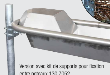
Version avec kit de supports pour fixation entre poteaux 130.7052