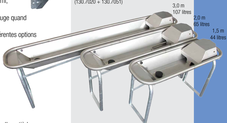
Version avec kit de pieds pour fixation au sol