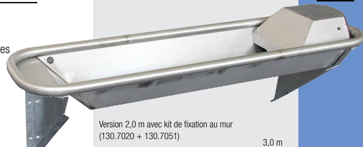
Version 2,0 m avec kit de fixation au mur (130.7020 + 130.7051)