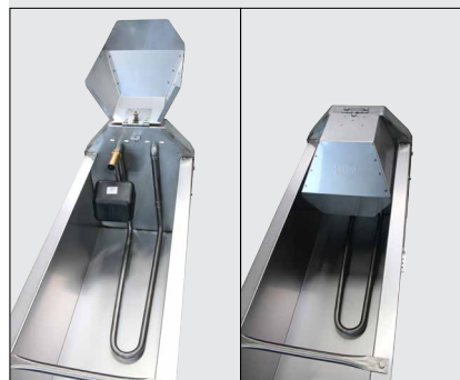
130.6181 Grand Volume 3,15 m avec: - 131.6103 Tuyau de passage ¾" - 131.0723 Flotteur MASTERFLOW - 131.0775 Capot d'accès au flotteur