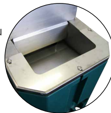
Rebord anti-lapage (réf. 131.1193) limite le gaspillage d'eau