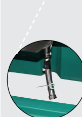
Livré avec un tuyau tressé et un câble chauffant 24 V