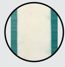
double paroi isolée