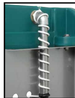
Version chauffante, arrivée d'eau à l'air libre avec un câble chauffant