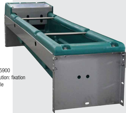
130.5900 Exécution: fixation murale