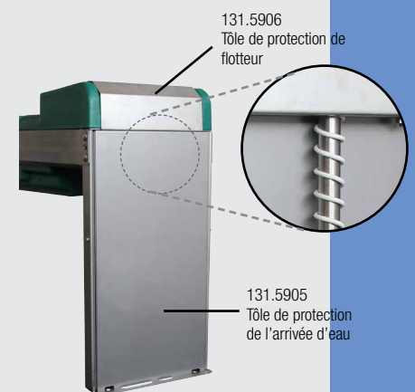
131.5906 Tôle de protection de flotteur