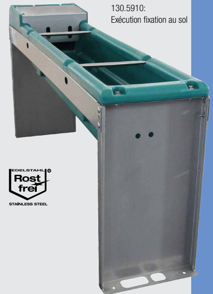
130.5910: Exécution fixation au sol