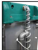
Version chauffante, raccordement à un circuit en boucle avec un câble chauffant