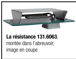
La résistance 131.6063 , montée dans l'abreuveur, image en coupe