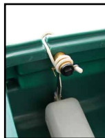
avec un câble chauffant autour du flotteur