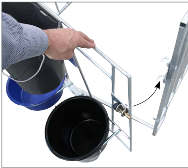
Ouverture de la porte de servitude d'une seule main. Se referme par simple claquement.