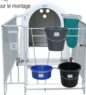
Accessoires voir p. 78