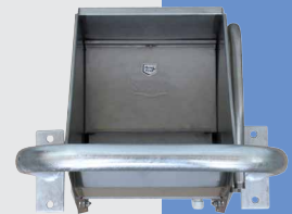
131.1391 Protection, galvanisée pour Mod. 480, 500, 600