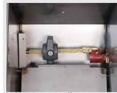
Manchette chauffante pour la soupape (réf. 131.0527)