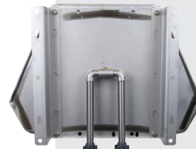
¾": 103.3004 1": 103.3007 pour Mod. 520