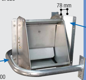
131.1394 Protection, galvanisée pour Mod. 480, 500, 600 monté avec fixation murale 90°