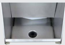
Bonde de vidange vue de l'intérieur