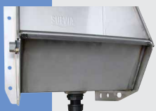
Bonde de vidange vue de l'extérieur