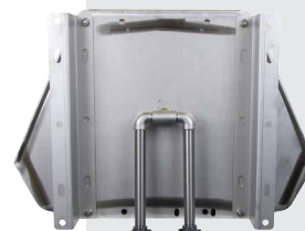
¾": 103.3004 1": 103.3007 pour Mod. 620