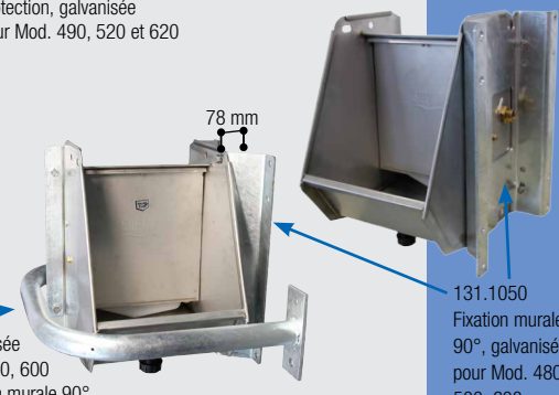
131.1394 Protection, galvanisée pour Mod. 480, 500, 600 monté avec fixation murale 90°