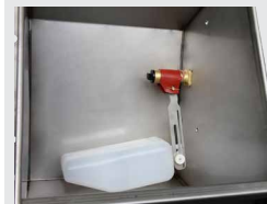
Manchette chauffante pour la soupape (réf. 131.0527)