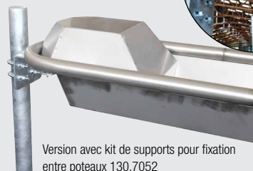
Version avec kit de supports pour fixation entre poteaux 130.7052