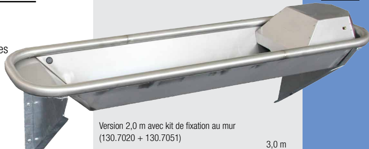
Version 2,0 m avec kit de fixation au mur (130.7020 + 130.7051)