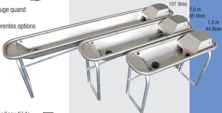
Version avec kit de pieds pour fixation au sol