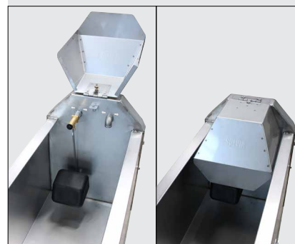
130.6181 Grand Volume 3,15 m avec: - 131.0726 Flotteur MASTERFLOW à levier prolongé - 131.0775 Capot d'accès au flotteur