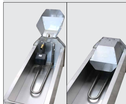
130.6121 ou 130.6131 Grand Volume 2 m ou 3 m avec: - 131.6102 Tuyau de passage ¾" - 131.0723 Flotteur MASTERFLOW - 131.0775 Capot d'accès au flotteur