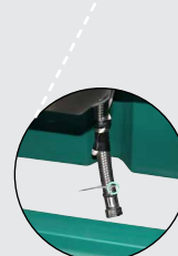
Livré avec un tuyau tressé et un câble chauffant 24 V