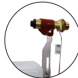
Manchette chauffante 131.0527

Pour les régions ayant un hiver rigoureux une manchette chauffante pour la soupape Modèle 527 (24 V, 7 W, réf. 131.0527) peut être installée postérieurement.