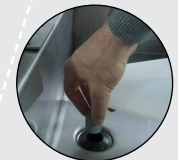
Avec bouchon de vidange en fond de cuve