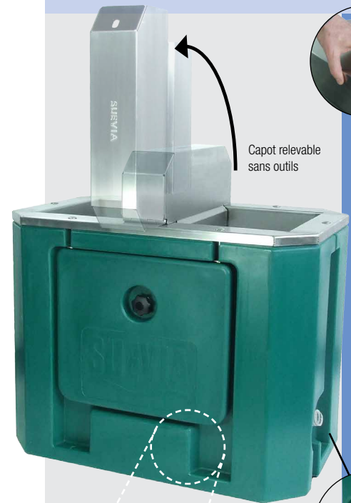
Capot relevable sans outils

Ouverture facile du capot d'accès, sans outils !