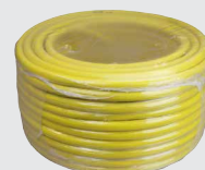
50x 202.0134 (rouleau de 50 m)