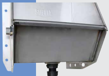
Bonde de vidange vue de l'extérieur