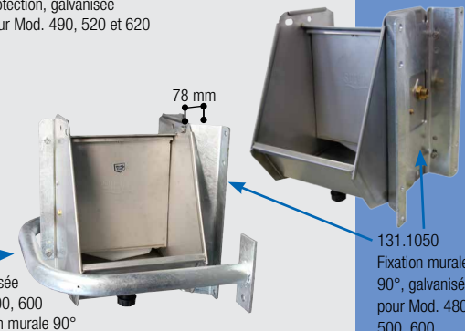
131.1394 Protection, galvanisée pour Mod. 480, 500, 600 monté avec fixation murale 90°