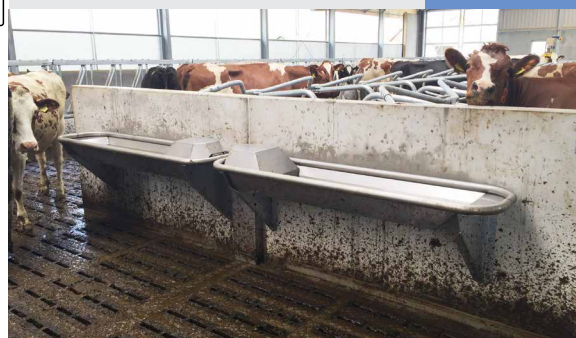
Version avec kit de pieds pour fixation au sol