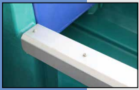
131.6065 Protection anti-morsures