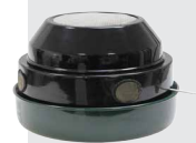
101.0550 Chauffage à paraffine