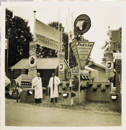
L'exposition DLG, à Köln

Comme il n'existait pas encore de camions puissants à l'époque, l'emplacement de la fonderie à proximité de la gare était très important. Cela permettait d'acheminer les matières premières vers la fonderie et d'expédier les abreuvoirs par le chemin de fer.