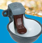
Mod. 55 HACO