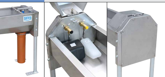
Tuyau d'évacuation DN 125 (à prévoir sur place): pas de sol verglacé en hiver