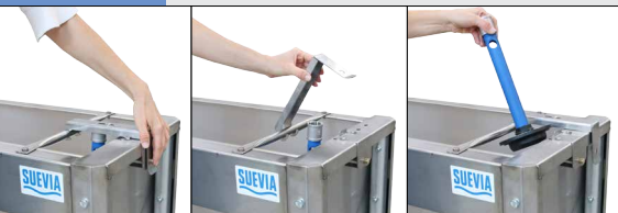
Plaque support DE LUXE: pour ouvrir et fermer le bouchon de vidage facilement, sans mettre les mains dans l'eau