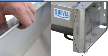
Rebord refoulé vers l'intérieur, angles arrondis