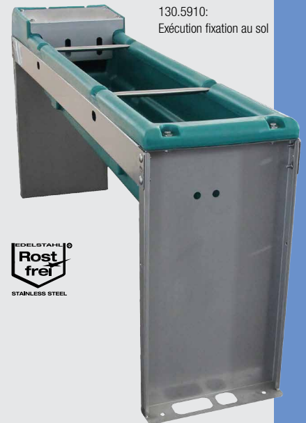
130.5910: Exécution fixation au sol